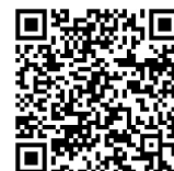
協力員登録 QRコード

また、SOS おたすけネットワークの対象者（徘徊の可能性のある方）として登録をご希望の方は、ホームページから登録票をダウンロードできますので、記入のうえ、当会まで登録票をお持ちください。