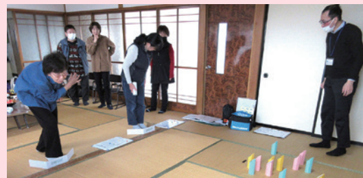
扇田会館 レクリエーションでモルックを体験する様子

新たに始めてみたいという地区や詳しい内容を聞きたい方はお気軽にお問い合わせください。