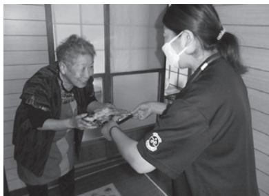
配食サービス事業