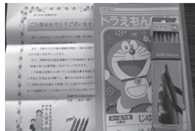
地域子育て支援事業 (小学校入学祝品)