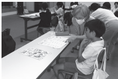
福祉教育活動推進事業 (サマースクールの様子)