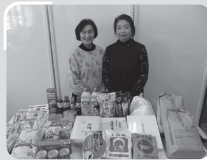
JA秋田おばこ六郷地区女性部様からフードドライブに寄付をいただきました。ありがとうございました。